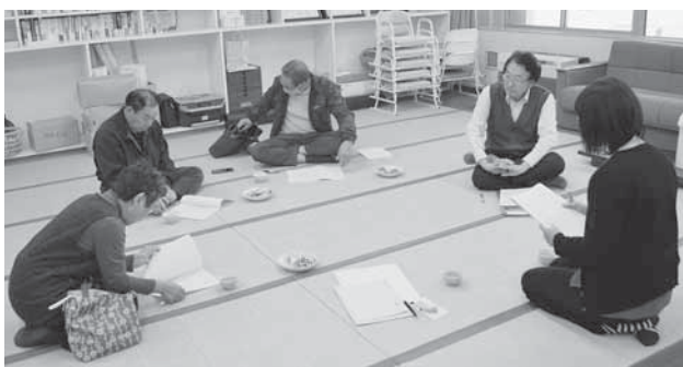
椿台地区のようす