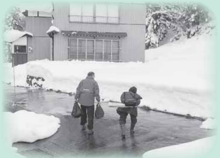
重い荷物を玄関先まで…