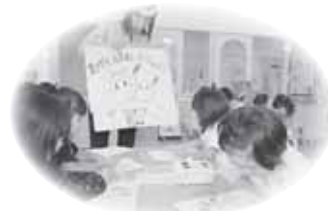
「赤い羽根」のぬり絵なるせ保育園の園児