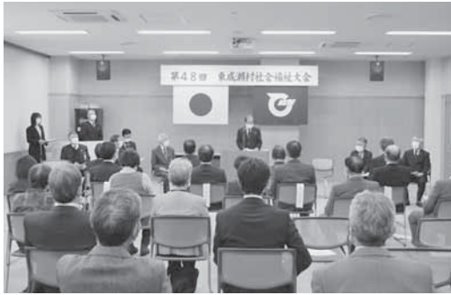
佐々木会長のあいさつ