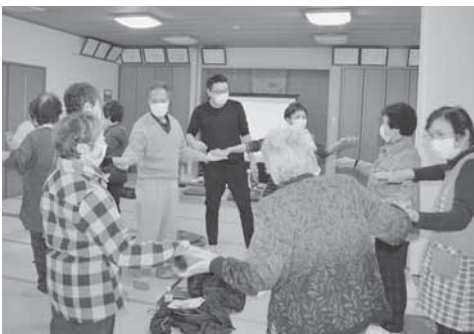
福祉講座のようす