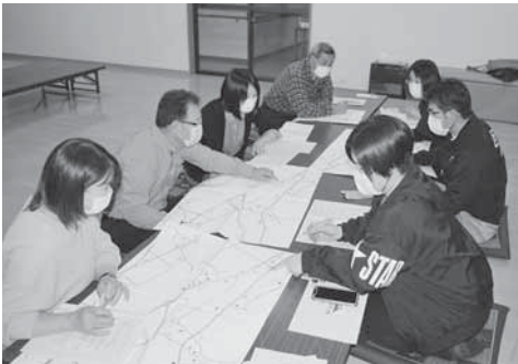
ネットワーク連絡会のようす