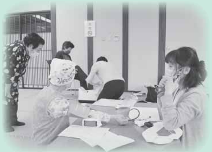
保健師さんによる健康チェックと骨密度測定(岩井川地区)

日程については4月の村広報でチラシを配布しております。多数のご参加お待ちしております。