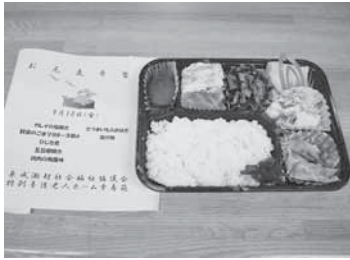
配食サービスのお弁当