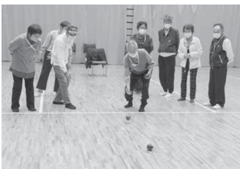
ふれあいのつどい ポッチャで楽しく交流