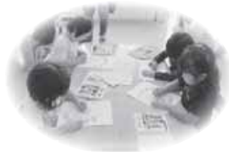
「赤い羽根」のぬり絵 なるせ保育園の園児