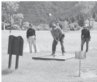
老人クラブ連合会 パークゴルフ大会