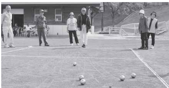
老人クラブ連合会のパタンク大会で気持ち良い汗をかきました