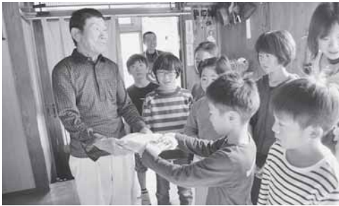
ふれあいボランティア活動で手作りのお弁当を配達しました