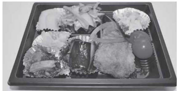
毎週火・金曜日に食事サービスを行っています