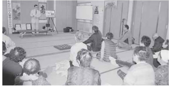
住民福祉講座のようす