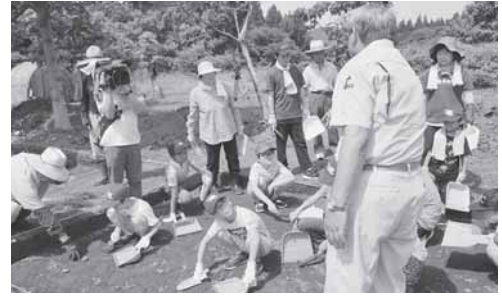
老人と子どものつどいでは上埴遺跡で縄文時代体験教室を行いました