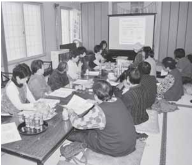
大柳地区にて研修のようす

ゆいっこ事業は、日常生活の中で直面する「ちよっとした困りごと」や「不安に感じたこと」があつた時にお互い様の精神で支えあう活動を行っています。事