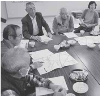
下田地区にてマップの見直しのようす

前にチケットを購入していただき、上限1時間でサービスを利用できるシステムです。現在は21名の会員が登録していますが、会員が全くいない地区もあり課題になっていきます。お盆やお正月前の買い物ツアーやお彼岸のおはぎ作りだけでなく、日々の細かな困りごとにも対応できればとの要望もあります。参加者からも、ゆいっここの会についても沢山の質問や、「いつもおはぎを購入させてもらっている。今後も頑張ってもらいたい。」等のお話もあり、ゆいっこ事業に興味を持っていただける貴重な機会になりました。 後半の座談会では、地区のマップを見直しながら、新たに安心電話を設置したほうがいいのか等はないか、心配な世帯はないか等を参加者全員で話し合いました。 また、下期のネットワーク連絡会ではこの時期になると心配な雪についての話も多く聞かれます。