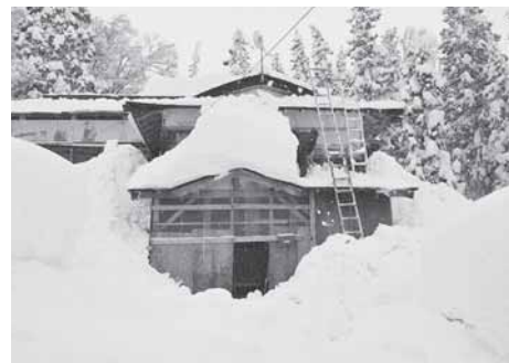
昨年度1月の雪下ろしのようす