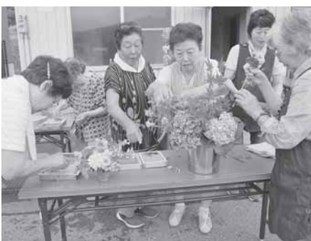
ふれあい・いきいきサロンでの紙すき