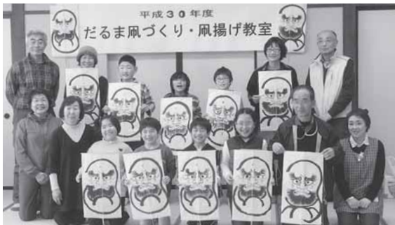
立派な凧ができたよ!!

おじいちゃん、おばあちゃんと協力しながら、それぞれのまなぐ凧を完成させた子供たち。天気にもめぐまれ、完成したばかりの凧を空高く揚げる事もできました。