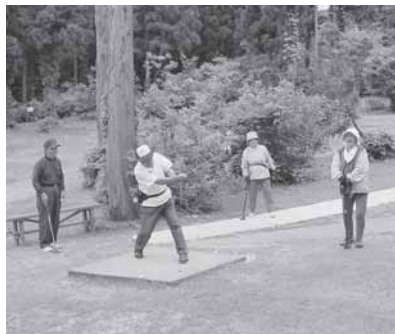
老人クラブ連合会の仲間がパークゴルフで交流