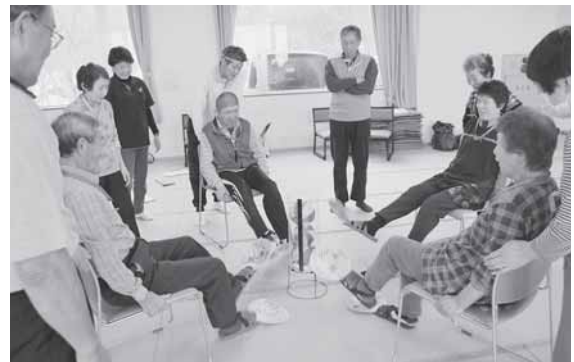
風力マッスルアップ!!

障がいを持つ方やその家族と福祉関係者・ボランティアの方の交流を図る会が開催されました。今回は東成瀬村レクリエーション協会の協力でレクリエーションを楽しみました。