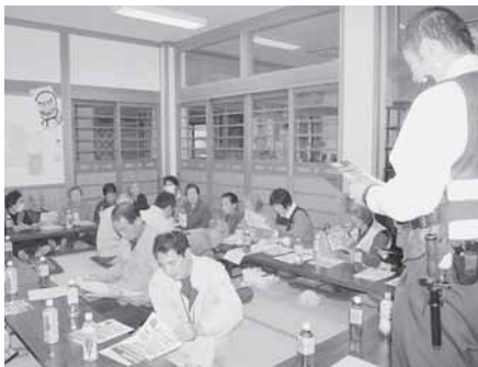
ネットワーク連絡会で駐在さんより講話