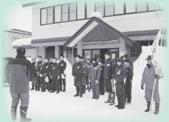
開会式の様子（さあ、頑張るぞ！）

2月16日、支え合う福祉の村づくりを進める一環として、初めて中学生による要援護者宅の「除雪ボランティア体験」を行いました。1・2年生23名が参加され、地区役員と社協役員のご協力もいただきながら無事終了しました。