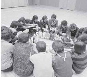
リズムに合わせてトントン♪

交流会では食事をしながら、今後の連合会活動について様々な意見が聞かれ有意義な研修となりました。