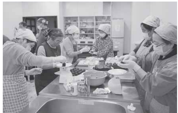
おはぎづくりのようす

なるせゆいっこの会では、地域の皆さんとお互い様の精神で支え合う活動の一環として、高齢者世帯を対象に彼岸の中日に合わせて行いました。今回は、127セットを手づくりし、計87世帯へ宅配しました。