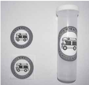
もしもの時の医療情報救急キット