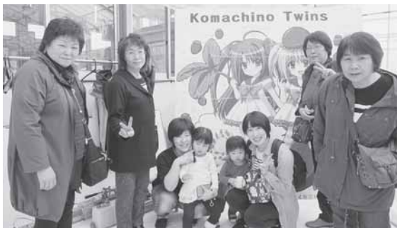
美味しいイチゴで大満足

情報交換や交流の場として活用してもらえるように、今後も呼びかけを行いながら活動を継続していきたいと思えます。