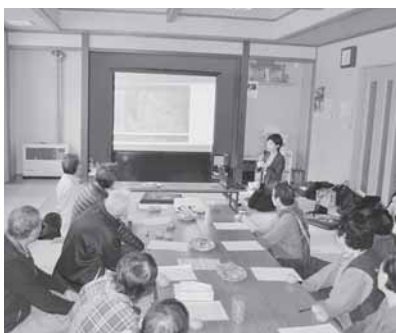
福祉講座のようす