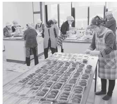
おはぎつくりのようす

3月20日、恒例の春彼岸おはぎ（ぼたもち）宅配サービスが行われました。会員は当日、朝早くから集まり、85世帯の高齢世帯へ118セット（354パック）を配達しました。