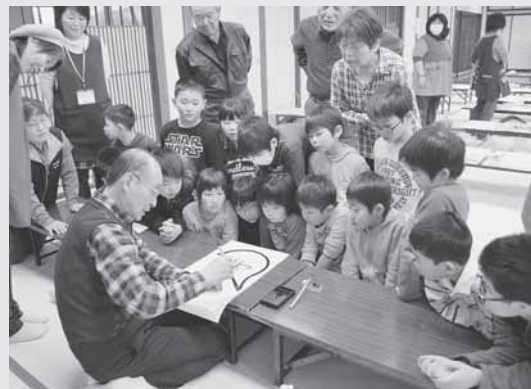
3/27 老人と子どものつどいにて。キラキラと真剣な眼差しでだるま凧づくりを習っています。

Q トは、救急医療情報キットは、どんなものですか。 A 自宅ですぐにケガをした場合、救急医療情報キットは、救急医療情報キットの専用容器に入れて、救急時にこのキットを活用することで迅速な救命活動を行うことができます。 東成瀬村社会福祉協議会では、65歳以上の1人暮らしや老人世帯等で、ふれあい安心電話を設置している方を対象にキットの導入を開始しました。今後、対象者を徐々に拡大していく予定で、対象者の方には民生委員等を通じてご案内を致します。詳細を知りたい方は、社会福祉協議会(471-2700)までお問い合わせください。