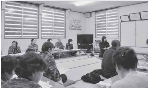
2/3 肴沢・蛭川地区ふくし座談会にて、地域の課題やご意見を住民の皆さんからお聞きしました。