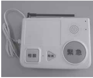
“もしも”のときの安心電話