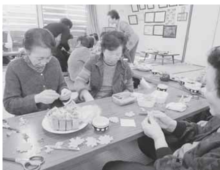
ふれあいいいききサロンでの創作活動のようす