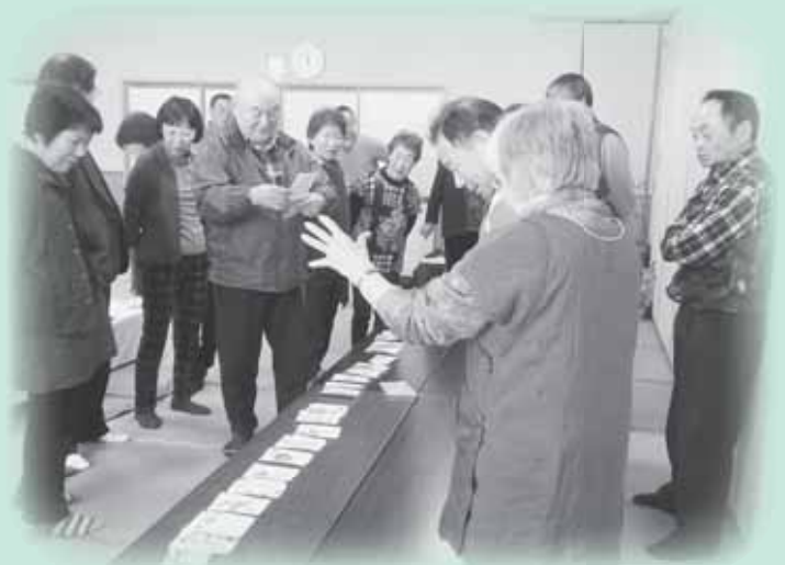
講師の「なるせ和紙の会」の先生方も満足顔

3/15 ボランティアと障がい者の交流を図るふれあいのつどいにて、なるせ和紙を使った絵てがみづくりに挑戦！