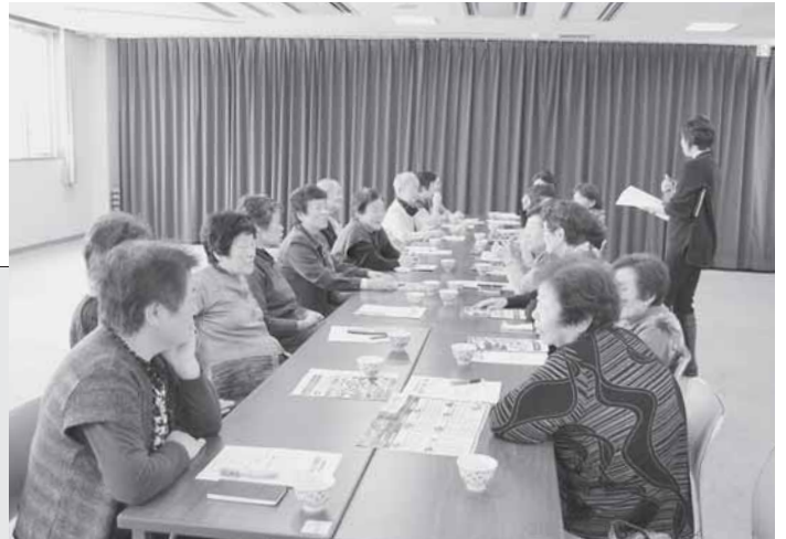
1/31 老人クラブ女性リーダー研修では、9月開催のねんりんピックの取り組みについて話し合いました。