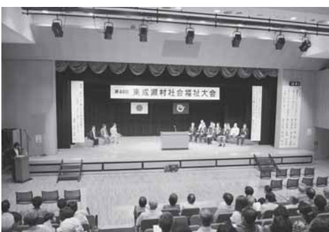
7月に行われる社会福祉大会のようす