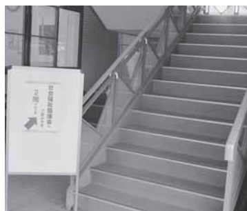
正面玄関を右側の階段でどうぞ。

これまで山村開発センター1・2階にありました社会福祉協議会事務所が、4月より保健センター2階へ移動しました。それに伴い、老人クラブ連合会やシルバーバンク、ボランティア関係などの窓口も一緒に移動となりましたので、お間違えのないようお願いいたします。