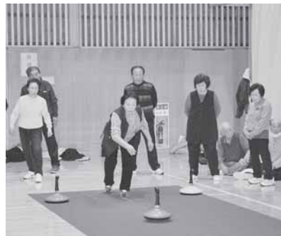
老人クラブ連合会ユニカール交流会のようす