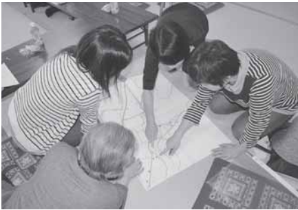
年2回のネットワーク連絡会で要支援者マップを見直します