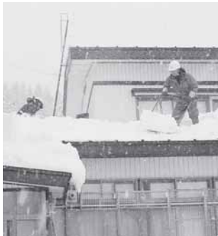
雪下ろし作業のようす

平成28年度も、地区福祉推進協議会・雪下ろし活動員・各関係団体の方々にご協力いただき終了することができました。活動された皆様、本当にありがとうございました。