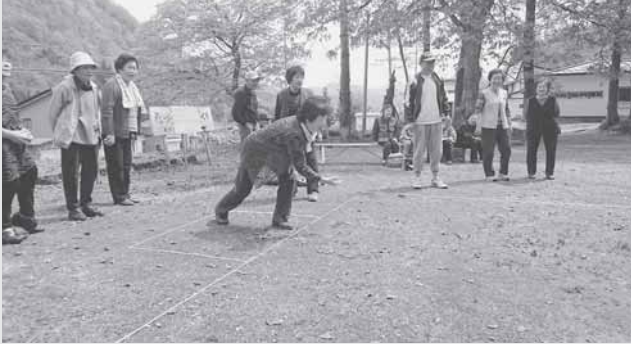
5/6 着沢・蛭川地区ふれいきサロンでペタンクを楽しみました。