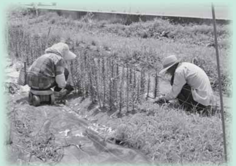
シルバーバンクによる草取りの様子