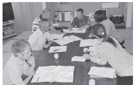
マップ見直しの様子

対象者がいない地区もありましたが、マップの見直しをしながら地区の課題や心配な点についても話を伺うことができました。今後の活動に繋がっていきしたいと思います。