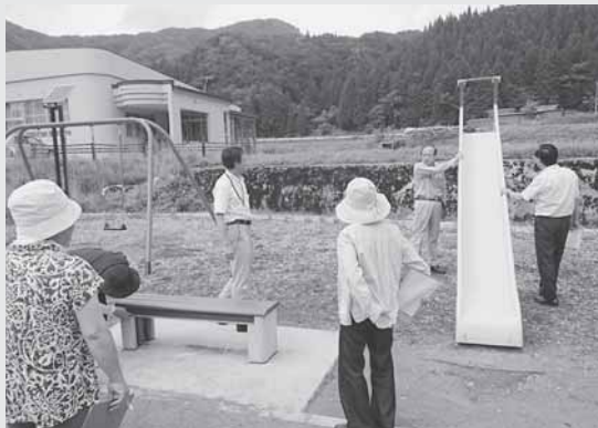
7/1 児童母子父子福祉部会で子供の広場等の遊具点検を行いました。