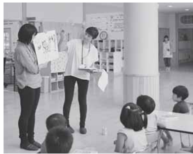
紙芝居に興味深々の園児たち

このぬりえを園児の皆さんに塗っていただく前に、職員がなるせ保育園に出向き、「あかいはねってなに？」という手作りの紙芝居で説明を行いました。