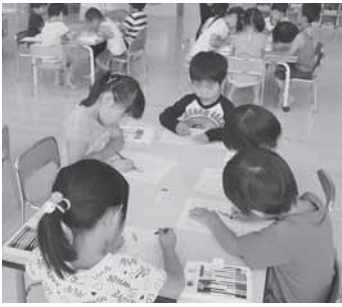
一生懸命塗ってくれました

7月16日開催された社会福祉大会・たすけあいチャリティショーの会場に展示されていた、赤い羽根共同募金のシンボルキャラクター「愛ちゃん」と「希望くん」のぬりえはご覧になっていただけでしょうか。なるせ保育園の皆さんが一生懸命塗ってくれたこのぬりえは、社会福祉大会・たすけあいチャリティショーの会場に彩りを添えてくれました。