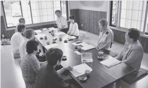
6/24 身体障がい者更生協会の総会が行われました。