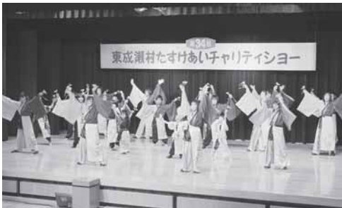
たすけあいチャリティショーの様子