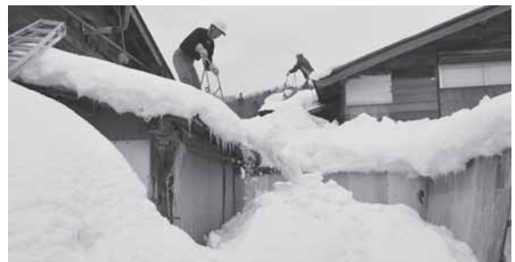
昨年度も雪下ろし活動員の方々にはご難儀をかけました