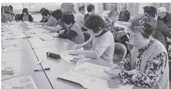
障がい者ふれあいのつどいの様子