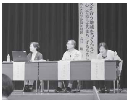
北秋田市地域づくりフォーラムのようす

平成29年4月からの日常生活支援総合事業の実施に向けて、生活を支援する担い手づくりが必要であり、地域での助け合い活動を展開していきたいという意思表示も確認できたようでした。 「ゆいっこの会」の活動需要は多くはないのですが、住み慣れた地域で安心して生活ができるよう、今後皆様のお手伝いをさせていただきます。