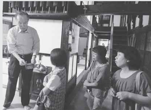
7/3 母子寡婦福祉会で「増田の蔵」を見学してきました。

Q 高齢一人暮らしの親がおり、足腰が悪く通院に困っています。外出支援サービスがあると聞きましたがどのようなサービスなのでしょう。か。 A 外出支援サービスは社会福祉協議会で受付を行っており、送迎は役場の運転手に対応しています。利用できる対象者と内容は次の通りです。 ●対象者：高齢者世帯、重度身体障がい者で、通院及び買物等が単独では困難（家に車がない、定期バス等の利用が困難等）な方 ●内容：毎木曜日で村内、増田、十文字を含む湯沢方面、横手方面に隔週で実施。利用者費用負担はなし ●利用希望される方は、東成瀬村地域包括支援センターまたは、社会福祉協議会までご連絡ください。