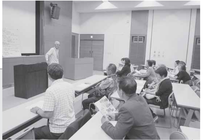
6/16 民生委員協議会では兵庫県「北淡震災記念公園」を視察研修しました。