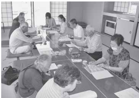
肴沢地区ネットワーク連絡会

加となり、利用者の生活様式に合ったセンサーが選択できるようにになりました。詳細を確認したい方は社会福祉協議会までお問い合わせください。