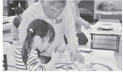
老人と子どものつどい（だるま風作り）