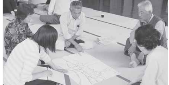
ネットワーク連絡会でのマップの見直し