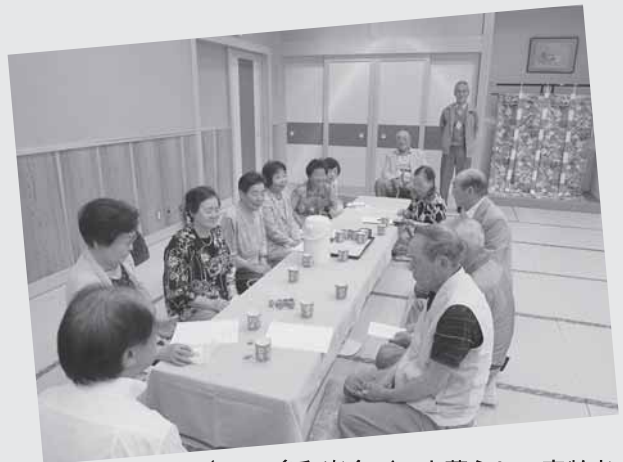
6/28 多和楽会（一人暮らし・高齢者世帯）では雄勝町で総会が行われました。