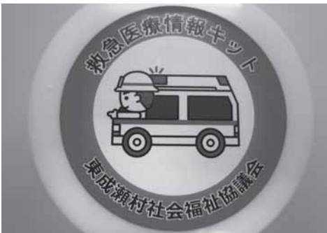
「救急医療情報キット」このステッカーが目印です

急医療情報キットとは、自宅内で具合が悪くなった、怪我をした、など「もしも：」の事態に備えて「氏名」「生年月日」や「緊急連絡先」など本人や家族の情報、「かかりつけ医」や「持病」「お薬」などの医療情報を書いたカード、健康保険などの情報を入れて冷蔵庫に保管しておき、駆け付けた救急隊が状況に応じて救急医療活動に活かすものです。今回の研修で、このキットがどういうものなのか、どのように使われるのかをご理解いただけたかと思えます。キットは平成28年秋頃に導入できるところです。