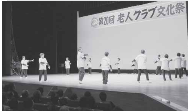
11/26 揃いの衣装を着け、初めての大舞台上で緊張しながら「なるせ音頭」を踊ってきました。