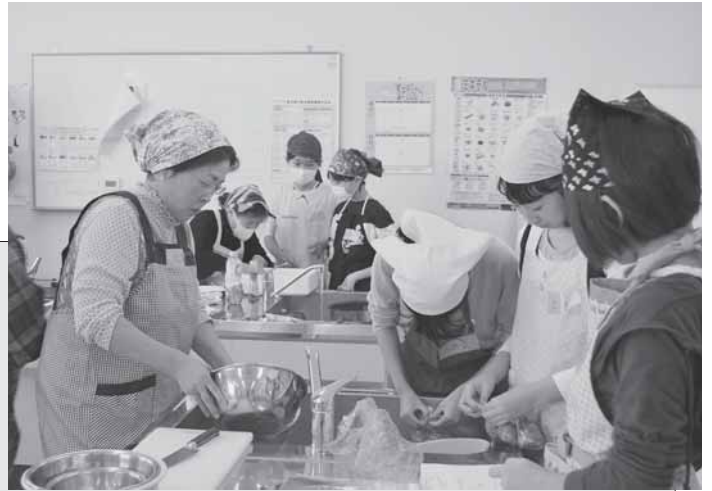
10/19 なるせ児童館と日赤奉仕団と一緒に作ったお弁当を一人暮らし等の方に届け「おいしかった」と評判でした。