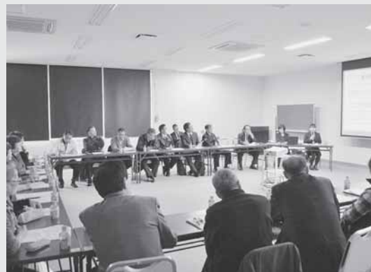
12/22 トータルケアサポート運営委員会において「りらとこCafe」の説明を受けました。