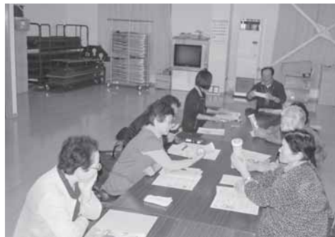
救急医療情報キットについての研修の様子