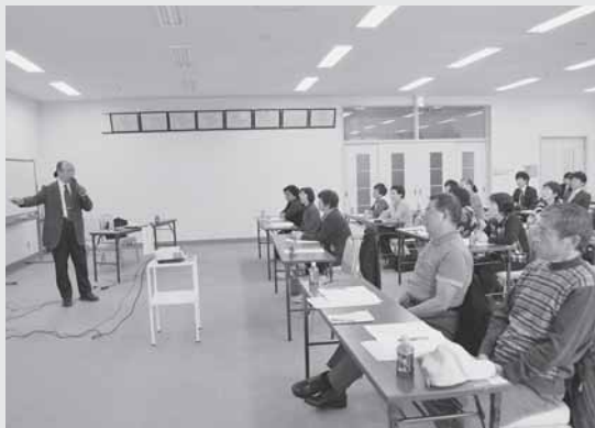
12/9 ボランティア養成講座で講師の先生の話聞きもらさないよう真剣に聞いています。