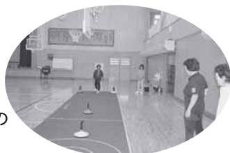
母子・寡婦福祉会 羽後町との交流の 様子