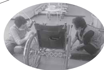
すみれの会 幸寿苑での車イス 掃除の様子