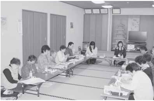
手倉地区ネットワーク連絡会の様子

昨年11月に村内9地区において下期ネットワーク連絡会が行われました。ふれあい安心電話を利用されている対象者とその協力員、地区の役員の方々に参加していただき、様々な話し合いがもたれました。