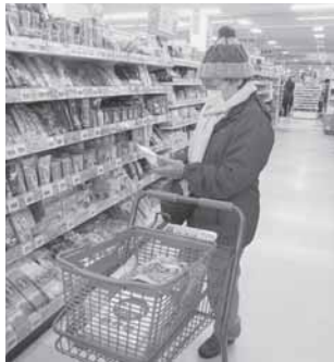
買い物ツアーの様子

また、付添いの会員は、ほしい品物の場所へ誘導したり、食品の購入の袋詰めのお手伝いをしたりと、利用された方より大変喜ばれました。