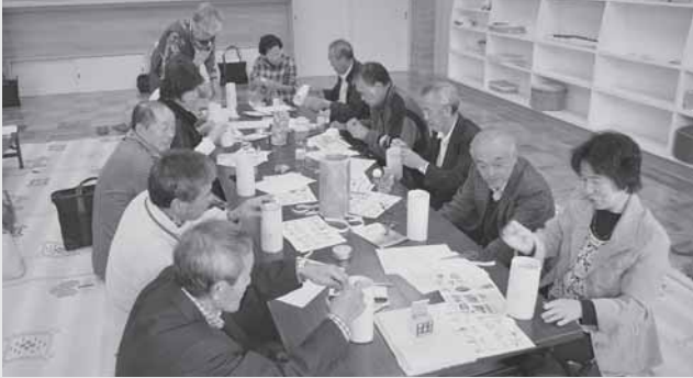
10/15 民生委員が皆瀬地区民生委員協議会と交流会を行い、なるせ和紙を使ってシェードランプ作りをしました。