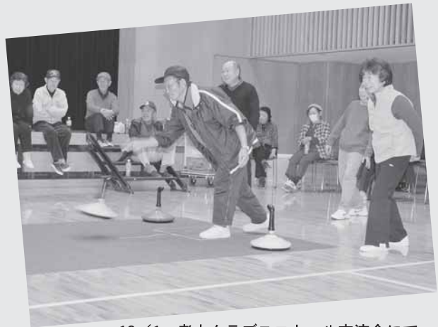
12/1 老人クラブユニカール交流会にて。「それ〜ねらったところでとまれ！」と願いストーンを投げています。