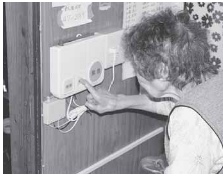
「もしも」のときのふれあい安心電話