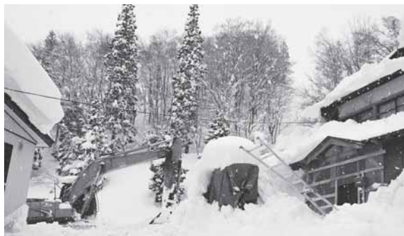
重機を使用している雪寄せの様子

関係者が集まり雪下ろし対策に関する情報交換会が開かれました。雪下ろしサービス事業について次のような課題が出されました。 ・活動員は勤めている方が多く人の手配をするのが大変。 ・雪が降ると依頼が集中するため、早めの対応は難しい。 ・初めての家は雪止めの場所が分からず危険である。 また、対策として、たくさん積もる前に、定期的に回って下ろす（集中しないように）、利用者への理解・周知を図るなど、さまざまな意見や課題が出されましたので、次年度へ向けて検討していきたいと思えます。