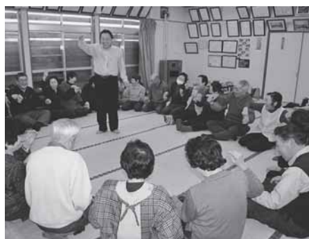
福祉講座でレクリエーション