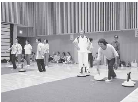
ユニカールで交流（ふれいきサロン）