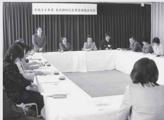
4/17 民生委員協議会総会が行われました。