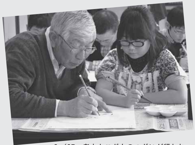
3/27 老人とこどものつどいが行われ、凧作りに挑戦しました。