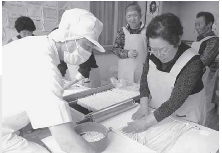
3/18 手をつなぐ保護者連絡会の移動研修にて、稲庭うどんの製造体験をしました。