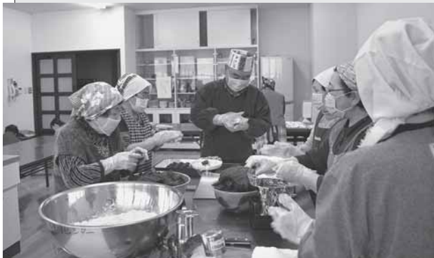
3/21 なるせゆいっこの会でおはぎを作り、高齢者の方々に宅配しました。