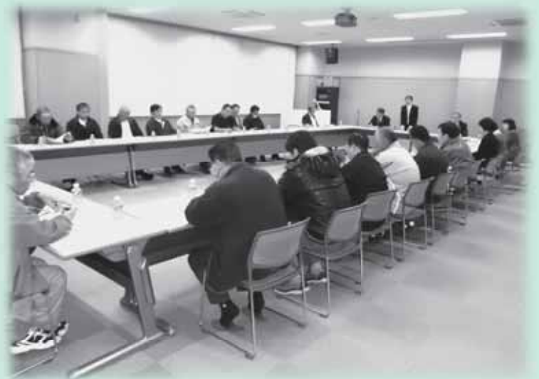
4/4 雪下ろし対策の情報交換会のようす