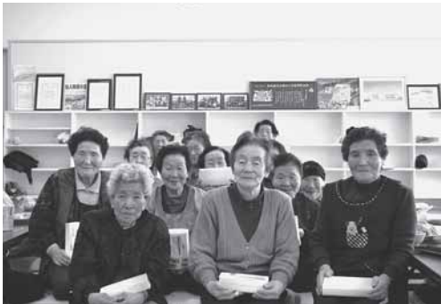
頂いたティッシュを手に「パチリ」

※こちらの寄付物品は、「地域 の高齢者の方々へ」というこ とで頂戴いたしました。