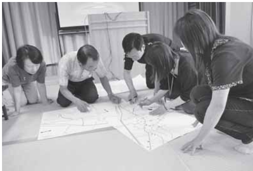
ネットワーク連絡会で要支援者マップを見直します。