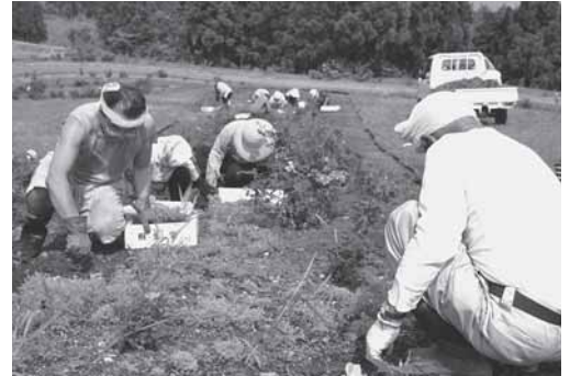
シルバーバンク会員による草取り作業