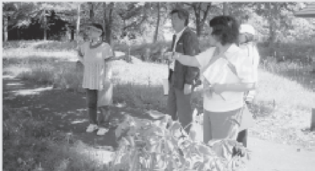
6/10 児童母子父子福祉部会では村内の公園等の遊具や危険箇所の点検を行いました。