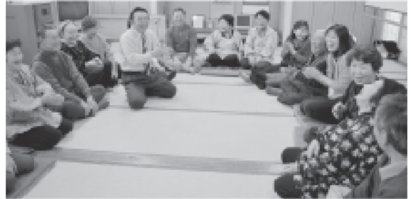
下田地区住民福祉講座