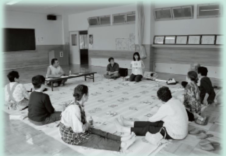
ネットワーク連絡会にて安心電話システムの再確認