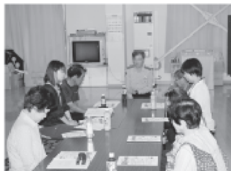
駐在所長さんよりご講話いただきました