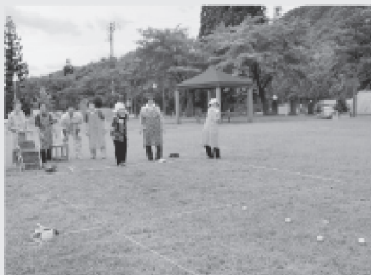
7/17 椿台・五里台地区ふれあいいきいきサロンではペタンクをしました。

自分がお住まいの地区のふれいきサロンについて詳しく知りたいという方は、地区の世話役又は社協までお問合せください。