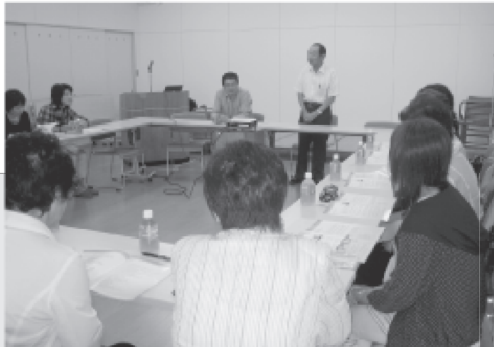
6/19 民生委員協議会では山形県NPO法人「きらりよしじまネットワーク」を視察研修しました。