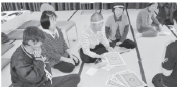
障がい者ふれあいのつどい