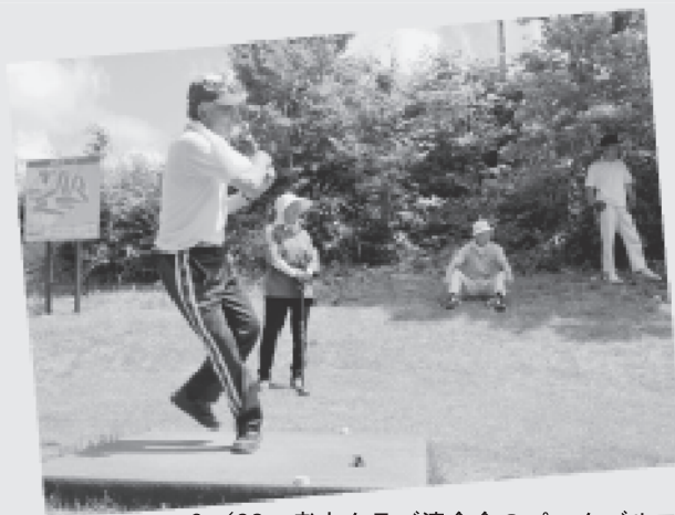
6/28 老人クラブ連合会のパークゴルフ大会が開催されました。