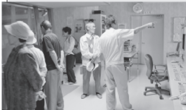
6/24 多和楽会（高齢世帯の会）では羽後町の貝沢ゴミ処理施設を視察しました。