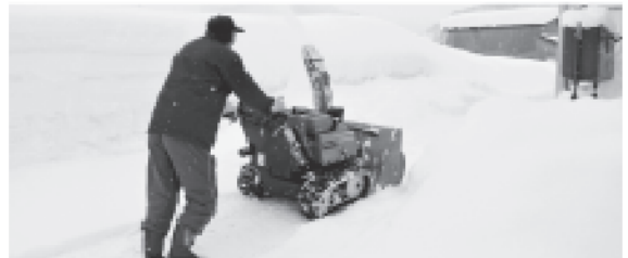
雪下ろしサービスでは除雪にも対応します