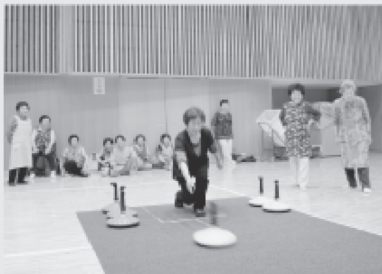
7/12 滝ノ沢・下田・岩井川地区合同ふれいきサロンでユニカールを楽しみました。