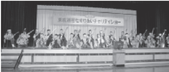
たすけあいチャリティショー