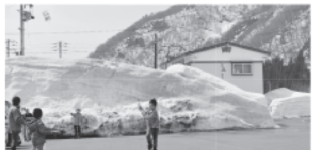
老人と子どものつどい（凧上げ）