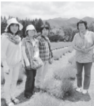
千畑ラベンダー園にて(6月)

東成瀬村母子・寡婦福祉会では、会員を募集しております。移動研修、創作活動、料理講習等、楽しい事業が盛りだくさんです。母子・寡婦関連の制度の勉強会や情報交換も随時行っておりますので、関心のある方は事務局までお問合せください。(47-2700事務局:藤原) ★入会条件:東成瀬村在住の母子家庭の母及び寡婦の方ならどなたでも ★年会費:一、五〇〇円