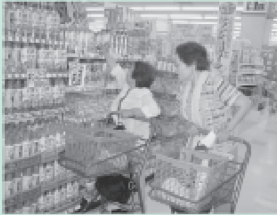
買物ツアーの様子

発足当初、この「ゆいっこの会」を利用する人や会員が、はたしてどれ位いるのだろうかかと心配しておりましたが、会員の方々の努力で、様々な活動が利用する方々に感謝さ